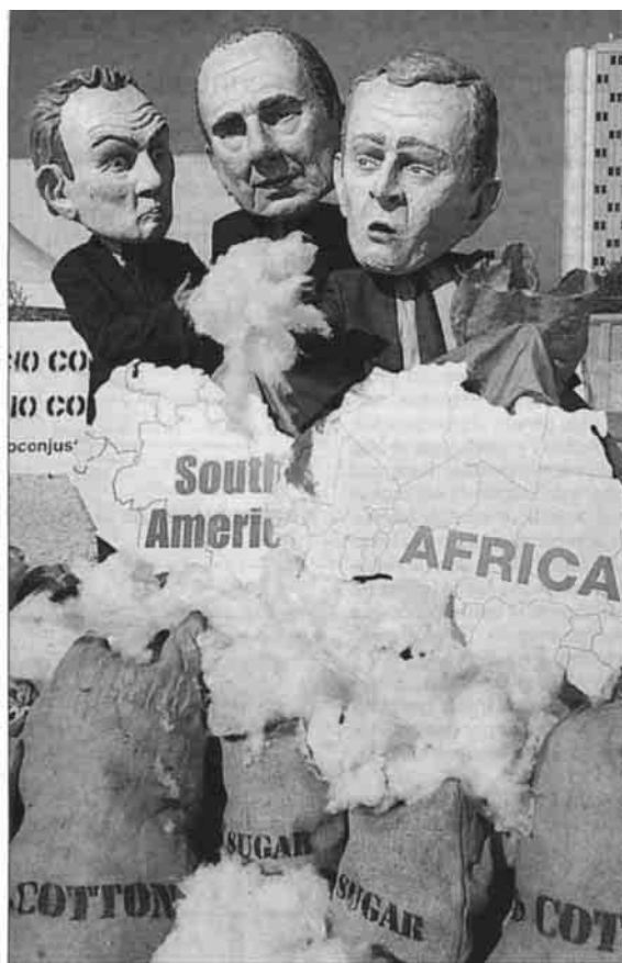
Muñecos de Blair, Chirac y Bush, en una manifestación en São Paulo.

Campaña ¿Quién debe a quién? Junio de 2006